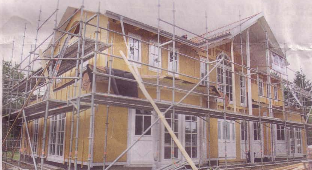
Dieses schicke Einfamilienhaus in ökologischer Holzbauweise entsteht am Moordamm in Buchholz-Seppensen

Unternehmen Zauberbau errichtet Domizil in ökologischer Bauweise